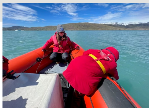
Glacial-Marine Module Qassiarsuup eqqaani

Juni 2022-imi ilinniartut professorillu 24-it nunatta kujataanut sapaatsit akunneri pingasut angalapput. Tassani aallarnisaa-taasumik SAUNNA Kalaallit Nunaat or-nigulluni misissuinikkut sulineq peqataaffigaat.