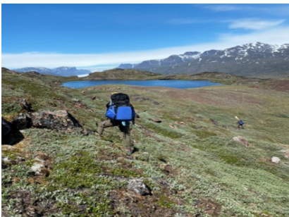
Ilisimatusartut nunakkut, misiliutis-sanik tigusinissaminnik atortuminnik nassarlutik tatsimut angalaarput.

Massakkumut katersukkat paasisutissaat misissoqqissaarlugit aallartinneqarput.