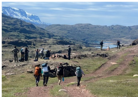
Arctic Carbon Cycle Module Tasiasap eqqaani

Qassiarsummi sapaatsip akunnera siulleq misilittakkanik katersuiner-mik, suleqatigiisinaanermik, ilisimatu-ussutsikkullu periutsit assigiingitsut atorlugit suleriuseqarsinnaanerit ingerlanneqarpoq. Qulequttat ilagaat Glacial-Marine/sermip-immap akun-nerminni ataqatigiinnerat, issittumi kulstoffip pissusaa aammalu issittumi inatsisit politikkillu.