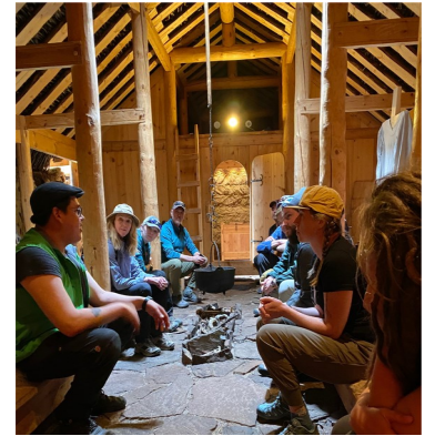
Aqqaluaq Frederiksenip qallunaatigaat illuanni angalaaruppatigut